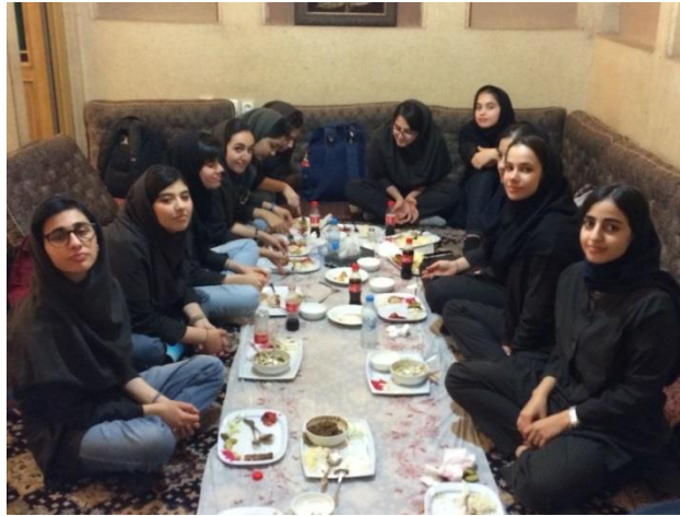
عصر پنج شنبه :

به سایت کویر گردی و رمل نوردی شباهنگ در نزدیکی یزد رفتیم . امکاناتی نظیر سافاری ، شتر سواری، موتور چهارچرخ، رصد ستارگان ، اسب سواری ... داشت که سافاری و شتر سواری از سوی دانش آموزان استقبال شد.پس از عکاسی در غروب آفتاب کویر تقریبا همه بدون استثنا سافاری سوار شدند . بعد به یزد برگشتیم و ۴۰ دقیقه در یک مرکز خرید جهت تهیه سوغات توقف داشتیم . بعد از آن از برنامه ویژه و بسیار خوب زورخانه دیدن کردن که اکثریت قریب به اتفاق دانش آموزان آن را تجربه منصر به فردی دانستند .